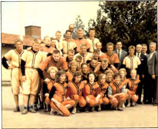
Haminan Palloilijoiden joukkueet LMV:n 30-vuotisjuhlissa.